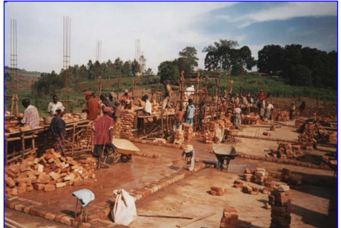
Viele Bauarbeiter, auch Frauen und Mädchen, können sich ein bisschen Geld verdienen