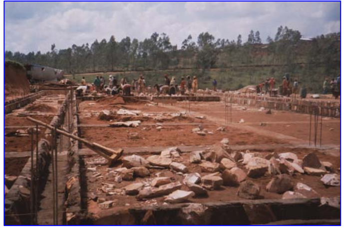
Die Fundamente werden gelegt