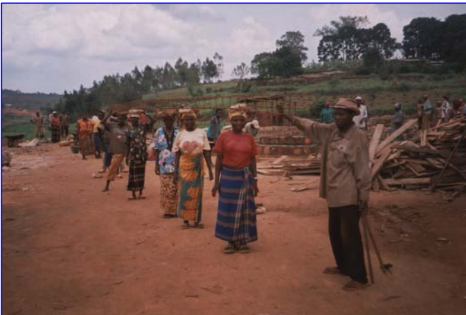
Steine und Materialien werden z.T. auf dem Kopf oder mit Schubkarren transportiert