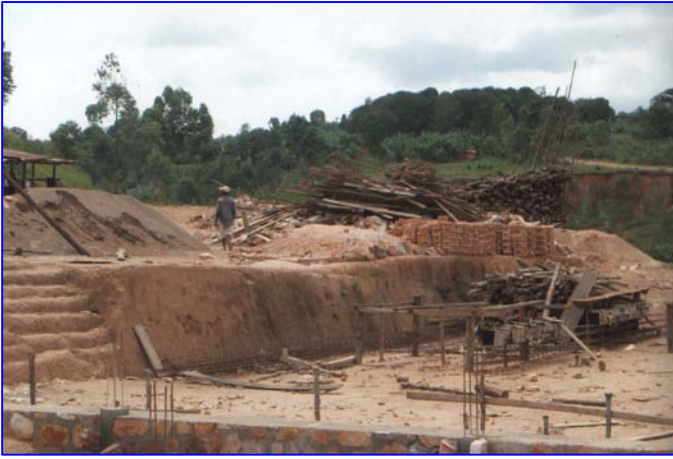
Die Baugrube für die Fundamente wurde von Hand ausgegraben, mit Pickel und Schaufel