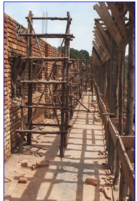
Mit Hunderten von Eukalyptuspfählen werden die Baugerüste gebaut